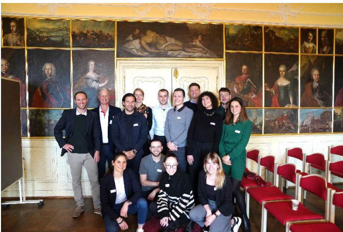
Das Alumni Organisationsteam 2024/2025