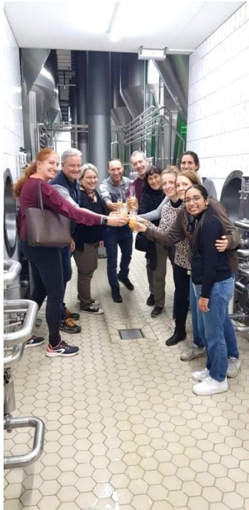
Teamevent 2024 in der Waldhaus Brauerei

Unser herzlicher Dank gilt allen, die den Studiengang BWL-Gesundheitsmanagement aktiv unterstützen und gemeinsam mit uns seine Zukunft gestalten!