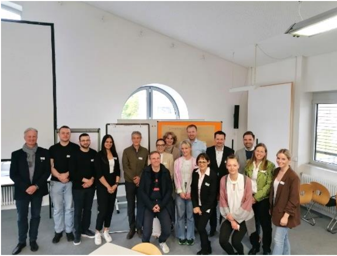
Das Dozierenden- und Ausbildungsleitertreffen 2024