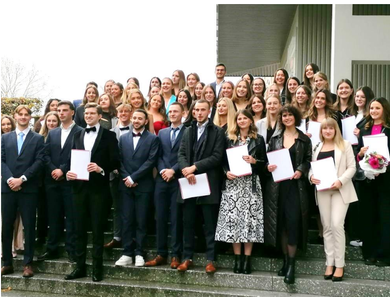
Der Abschlussjahrgang WHC20