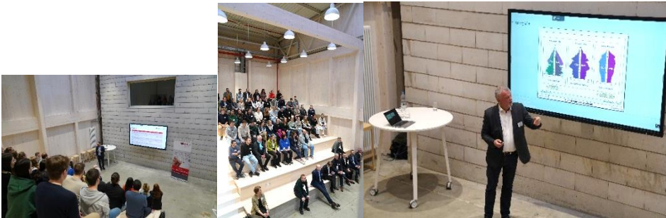
Impressionen des Let's Talk Health 2024 auf dem Vitra Campus (im Bild rechts: Peter Bechtel)

Zum ersten Mal zu Gast auf dem Vitra Campus wurde das Thema „Impulse für eine nachhaltige Versorgung im Gesundheitswesen“ behandelt. Ein Schwerpunkt der Diskussion war der Fachkräftemangel im Gesundheitswesen. In der Keynote referierte Peter Bechtel, Vorsitzender der Pflegekammer Baden-Württemberg und ehemaliger Pflegedirektor der Theresienklinik Bad Krozingen über seine Erfahrungen im Umgang mit dem Fachkräftemangel im Pflegebereich aus erster Hand.